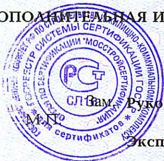
Схема сертификации За