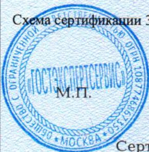
Схема сертификации 3.