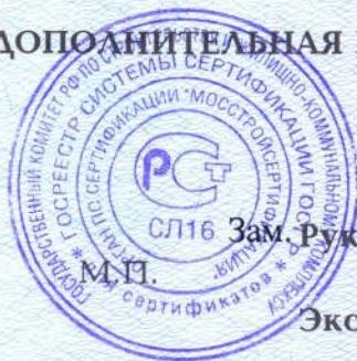
Схема сертификации За