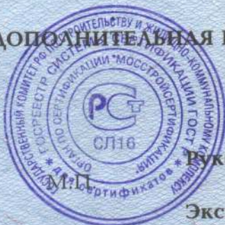
Схема сертификации За